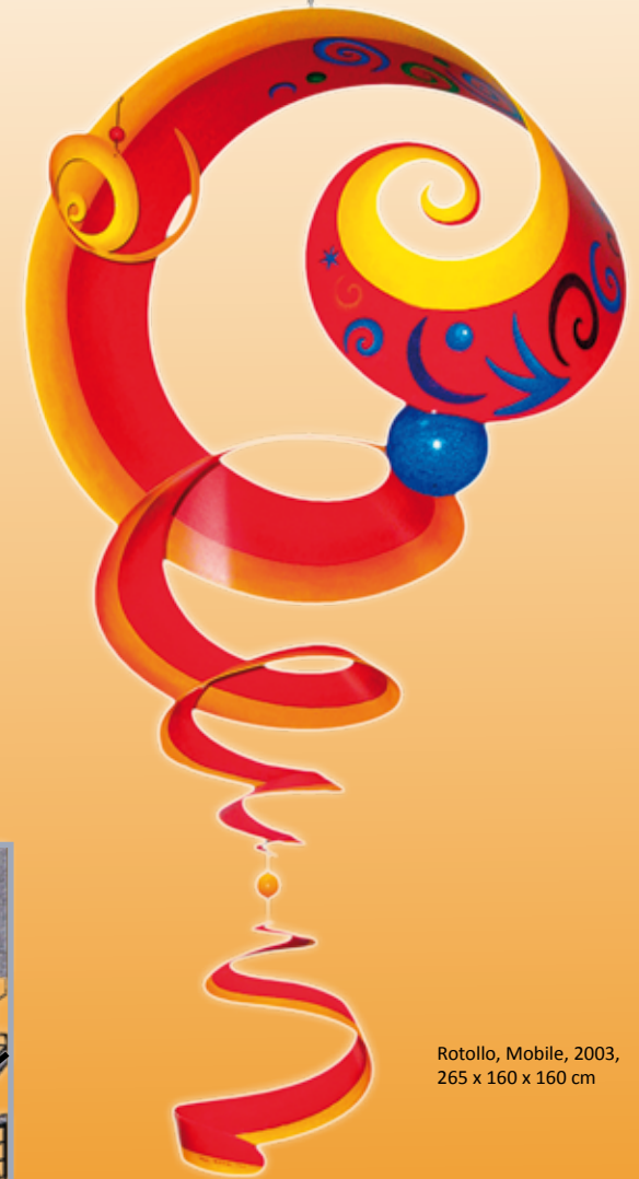
Rotollo, Mobile, 2003, 265 x 160 x 160 cm

kiz Universität West Abteilung für Strahlentherapie Robert-Koch-Strasse 6