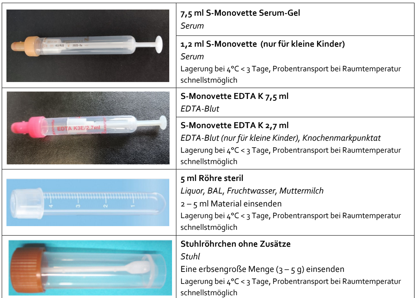
Tabelle 3: Entnahmesysteme

Hinweise für geeignete Entnahmesysteme zur Probengewinnung finden Sie in Tabelle 3 oder im Intranet .